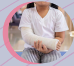
Paediatric Orthopaedics 小兒骨科