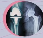
Joint Replacement 關節置換