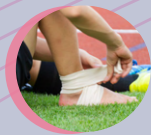
Sports Medicine 運動醫學