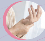
Hand Surgery 手外科