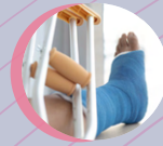
Orthopaedic Trauma 骨創傷科