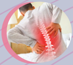
Spine Surgery 脊椎外科