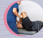
Orthopaedic Rehabilitation 骨科復康