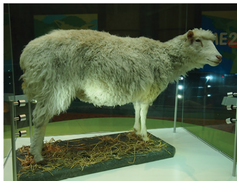
全球第一隻複製羊多莉於1996年誕生

幹細胞最終會形成哪種組織或器官，取決於多個「表觀遺傳」控制機理如啟動子基因甲基化的過程，當甲基附在基因上，基因表達便會靜止。以心臟的發展過程為例，所有非心臟細胞的基因均會被甲基化，只剩下心臟細胞的基因才表達，細胞便會受這些基因的指揮而形成心臟。